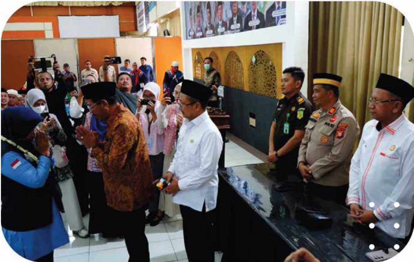
Kamis (12/06/2025) Wakil Ketua DPRD Kabupaten Bekasi bersama Unsur Forum Komunikasi Pimpinan Daerah (Forkopimda) Kabupaten Bekasi menghadiri Undangan dari Kementerian Agama Provinsi Jawa Barat dalam rangka Penyambutan Kloter Pertama Debarkasi JakartaBekasi Tahun 1446H/2025. Acara berlangsung di Aula UPT Asrama Haji Bekasi.