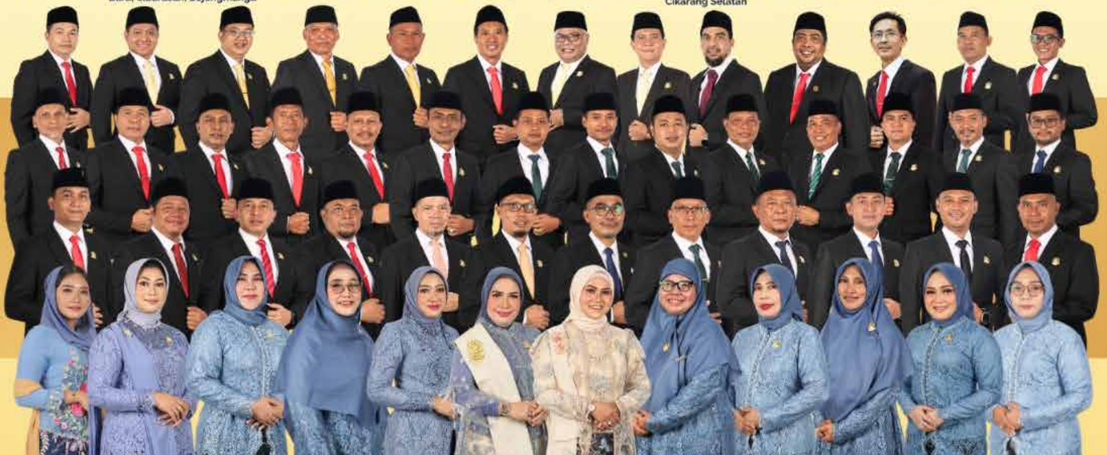
Dapil Bekasi 2 Cibitung, Cikarang Barat